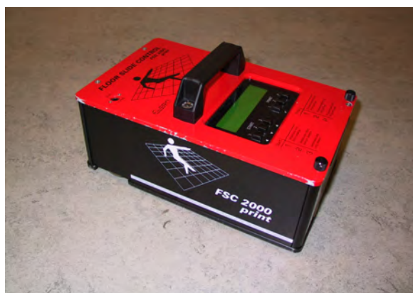
Illustration 5 Mesure sur le terrain avec un appareil mobile

Depuis quelques années, on tente d'élaborer une norme européenne pour mesurer les propriétés antidérapantes des revêtements de sol, mais le fait que de nombreuses méthodes d'essai se soient établies complique le processus.