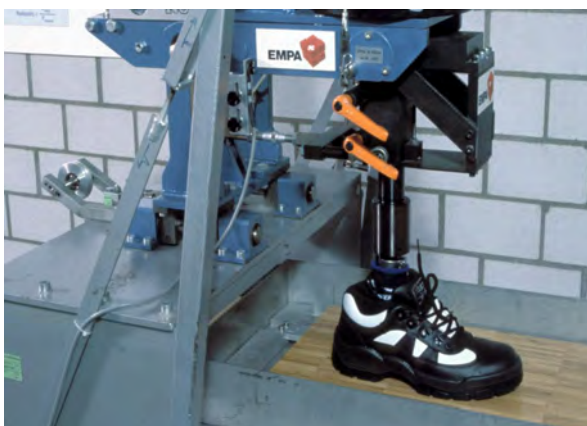
Illustration 1 Dispositif d'essai pour sols et chaussures BST 2000, Empa (St-Gall)

Les revêtements de sol sont affectés aux classes GS 1 à GS 4 pour le secteur chaussures et GB 1 à GB 3 pour le secteur pieds nus, ceux classés GS 4 respectivement GB 3 présentant les meilleures propriétés antidérapantes (Illustration 2, p. 12).